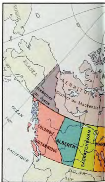
L'Ontario et le Manitoba atteignent leurs limites actuelles. Le Québec s'étend vers le nord jusqu'au détroit et à la baie d'Ungava, absorbant ainsi l'Ungava continental. La frontière du Labrador n'est pas déterminée.