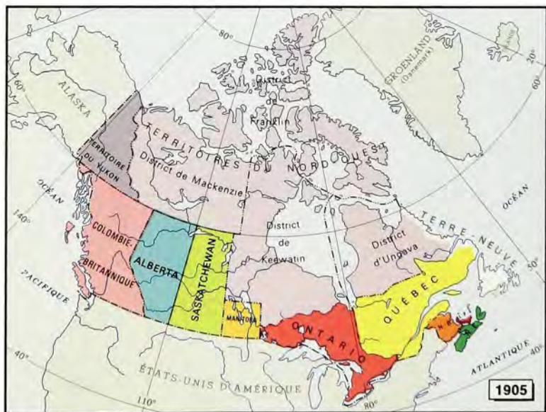
L'Acte de la Frontière ontarienne règle la question de la frontière Ontario-Manitoba (1889). Le District du Yukon est constitué un Territoire, distinct des Territoires du Nord-Ouest (1898). L'Alberta et la Saskatchewan sont créées provinces, ce qui porte à neuf le nombre total de provinces (1905). Le District de Kewatin est réannexé aux Territoires du Nord-Ouest. A cause des changements dans les régions avoisinantes, les limites des Territoires du Nord-Ouest sont redéfinies (1906).