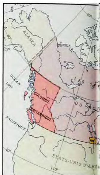
Le Canada acquiert les Territoires du Nord-Ouest (de la Baie d'Hudson) (1870). On en détache une partie, la Colombie-Britannique, qui se joint au Canada et devient la septième province (1873).